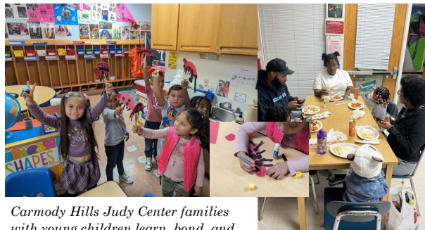
Carmody Hills Judy Center families with young children learn, bond, and play at Learning Parties.