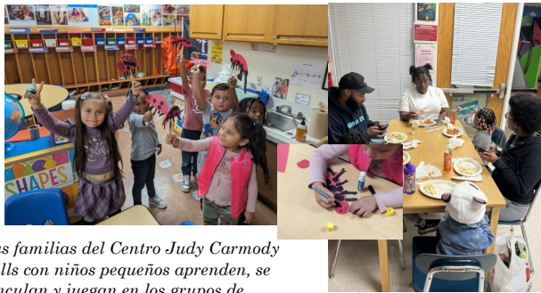
Las familias del Centro Judy Carmody Hills con niños pequeños aprenden, se vinculan y juegan en los grupos de aprendizaje.