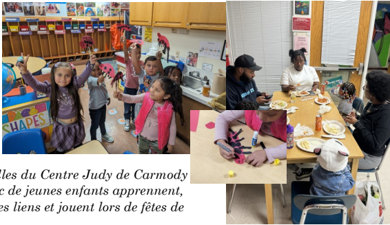
Les familles du Centre Judy de Carmody Hills avec de jeunes enfants apprennent, nouent des liens et jouent lors de fêtes de